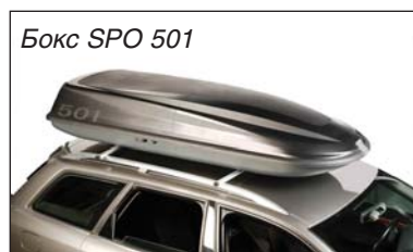
Бокс SPO 501