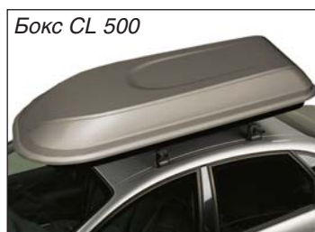
Бокс CL 500

Автомобильные боксы защищают багаж от грязи, влаги и пыли, они увеличивают полезный объем автомобиля, бокс можно установить на крышу вместе с другими насадками, например, багажником для велосипеда, сноуборда или лыж.