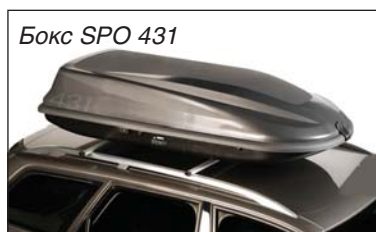
Бокс SPO 431