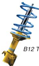
B12 Tuning Kit

Настройка подвески под индивидуальный стиль вождения каждого водителя прекрасные ходовые качества в любой ситуации и удовольствие от вождения. Возможность (на установленных амортизаторах!) регулировать высоту дорожного просвета (B14PSS, B16PSS9/PSS10) и 9/10 – ступенчатой параллельной регулировки демпфирования (B16PSS9/PSS10) простым поворотом настроечного колёсика позволяет обеспечить наилучшие настройки автомобиля для конкретной трассы и цели.