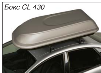
Бокс CL 430

Все боксы собираются на российском предприятии ООО «Металлопродукция» из итальянских комплектующих.