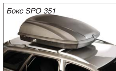
Бокс SPO 351