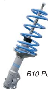
B10 Power Kit

4 укороченных двухтрубных газовых амортизатора + 4 короткие спортивные пружины: уменьшение дорожного просвета и агрессивный силуэт, повышенная безопасность при торможении, улучшение курсовой стойкости, уменьшение эффекта «раскачивания», достаточный комфорт.