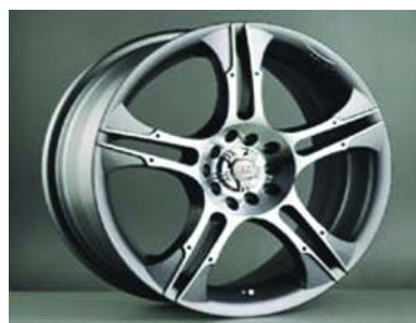
Модель диска на Daewoo Lanos и Sens: VS1347. Ширина: 5.5. Радиус: 13. Количество отверстий в диске: 8. Межболтовое расстоя- ние: 100/114,3. Цвет: серый.