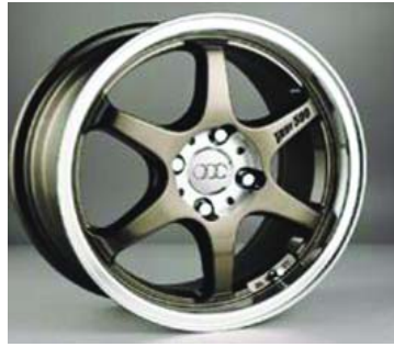
Модель диска на Daewoo Lanos и Chevrolet Aveo: VS1428.

Ширина: 5.5. Радиус: 13. Количество отверстий в диске: 4. Межболтовое расстояние: 98. Цвет: серебристый.