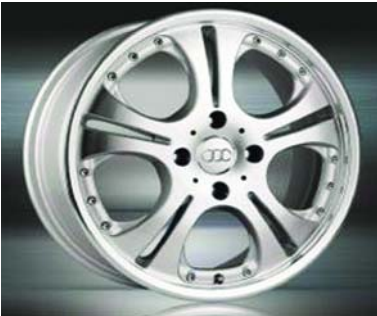
Модель диска на ВАЗ: VS1309.

Ассортиментный ряд, который компания «ЗипАВТО» предлагает своим клиентам, направлен на наиболее популярные сегодня модели автомобилей.