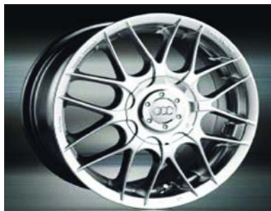
Модель диска на Daewoo Lanos и Sens: VS1352. Ширина: 5. Радиус: 13. Количество отверстий в диске: 8. Межболтовое расстоя- ние: 100/114,3. Цвет: серебристый.