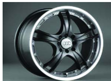
Модель диска на Chevrolet Lacetti: VS1533. Ширина: 6.5. Радиус: 15. Количество отверстий в диске: 4. Межболтовое расстоя- ние: 114.3. Цвет: черный.