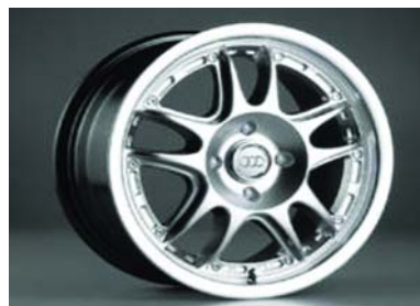
Модель диска на Chevrolet Lacetti: VS1531. Ширина: 6.5. Радиус: 15. Количество отверстий в диске: 4. Межболтовое расстоя- ние: 114.3. Цвет: серебристый.